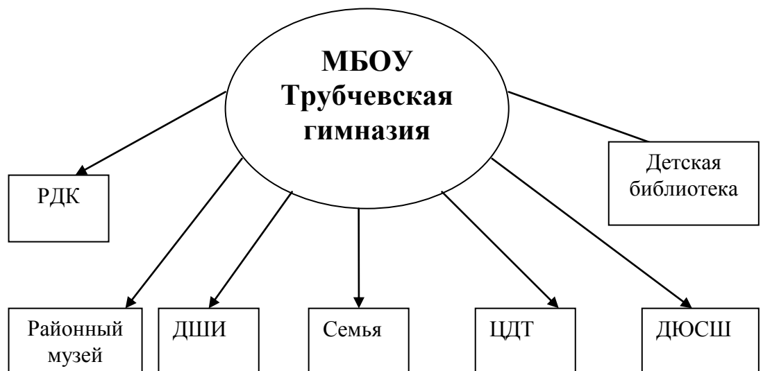
Схема совместной деятельности школы, семьи и общественности по духовно-нравственному развитию и воспитанию учащихся

В формировании нравственного уклада школьной жизни свои традиционные позиции сохраняют учреждения дополнительного образования и культуры, с которыми взаимодействует школа (районный музей, детская библиотека, РДК, ДШИ, ЦДТ, ДЮСШ)